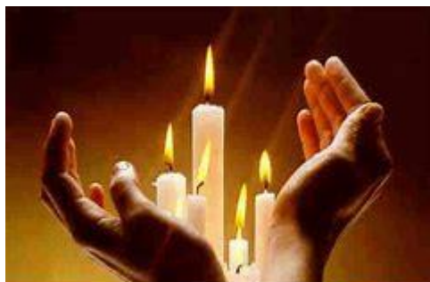
Prier pour les morts: la plus belle manière de donner du sens à sa vie!